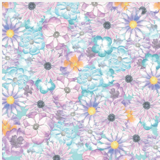
アネモネ、パンジー、ネモフィラ ブルーデージー

異なる表情の花々が一つの美しい庭園を作り上げるように 多様性が美しい調和を生み出すことを表現。