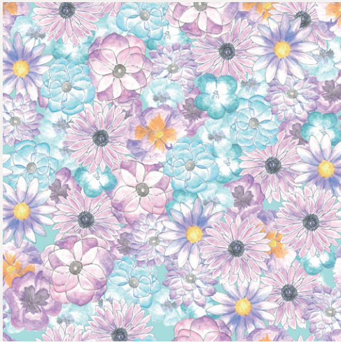
アネモネ、パンジー、ネモフィラ ブルーデージー

異なる表情の花々が一つの美しい庭園を作り上げるように 多様性が美しい調和を生み出すことを表現。