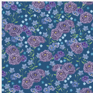
ランキュラス、パンジー、 オオイヌノフグリ、キキョウ