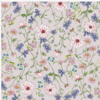
ランキュラス・ラックス、ピオラ マーガレット、わすれな草