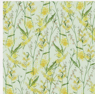
ミモザ、スイートピー