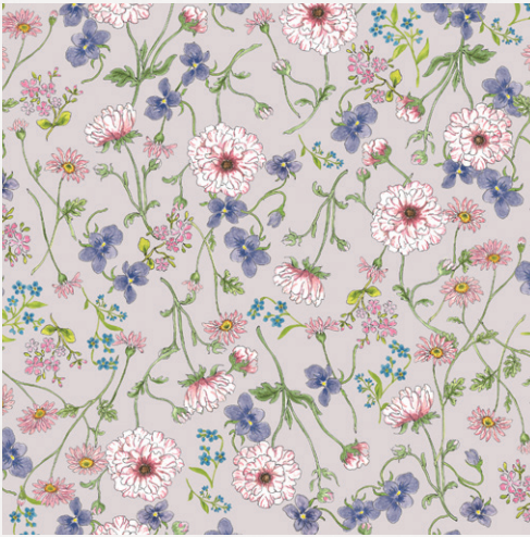
ランタンキュラス・ラックス、ビオラ マーガレット、わすれな草