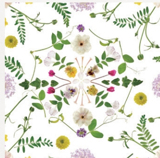
パンジー、ランキュラス、ブルーレース シクラメン、スイセン、マメ、マム キルタンサス