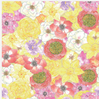
ランキュラス、アネモネ スイセン、パンジー