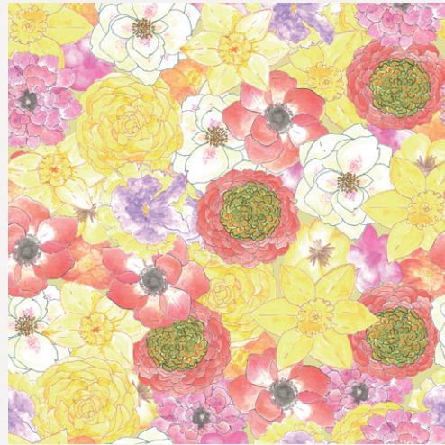
ラナンキュラス、アネモネ スイセン、パンジー