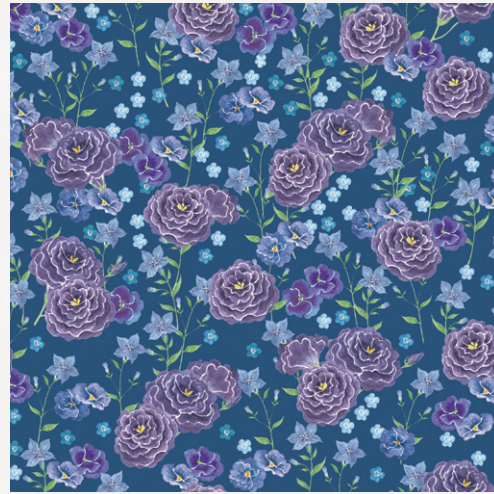
ランタンキュラス、パンジー、 オオイヌノフグリ、キキョウ